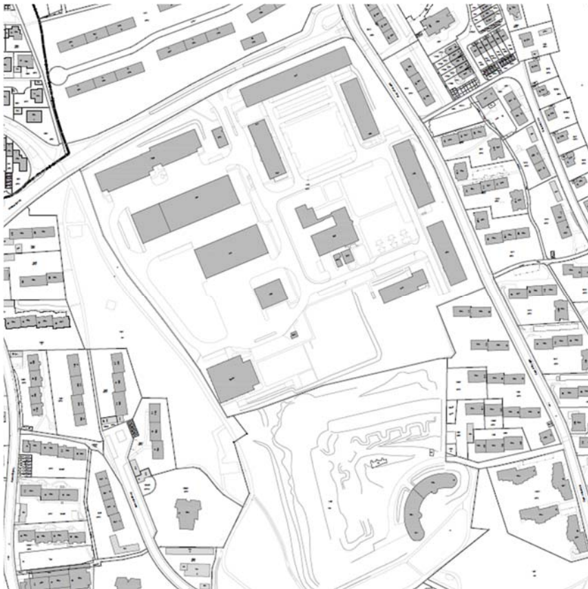
Abbildung 3: Liegenschaftskataster und Topographie

ÖPNV anbinden. Die Lage der Straßenbahntrasse und der Haltestellen ist bindend. Die Nahversorgung der künftigen Bewohner kann durch das nahe gelegene Einkaufszentrum "Stifterweg" sichergestellt werden. Der Stifterweg ist im städtischen Zentrenkonzept von 2013 als zentraler Versorgungsbereich ausgewiesen.