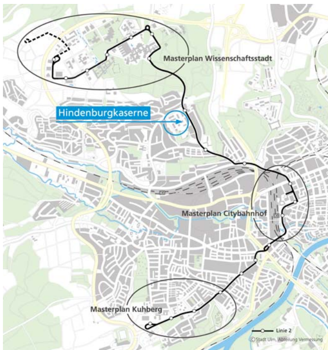
Abbildung 1: Stadtentwicklungsachse Straßenbahnlinie 2

Die Hindenburgkaserne ist eines von zahlreichen Stadtentwicklungsprojekten Ulms, die sich entlang des Streckenverlaufs der neuen Straßenbahnlinie 2 auffädeln. Insgesamt betrachtet, bieten die Entwicklungsflächen entlang der Linie 2 Potenzial für etwa 2.300 neue Wohnungen. 900 Wohneinheiten sollen auf dem Areal der Hindenburgkaserne entstehen. Dies entspricht einer BGF von 90.000 m 2 , einschließlich der drei bestehenden Mannschaftsgebäude. Zusätzlich soll ein Gewerbeanteil von 10% geplant werden. Dies entspricht einer BGF von 10.000 m 2 . Die GFZ soll sich im Rahmen von 1,5 bis 1,8 bewegen.